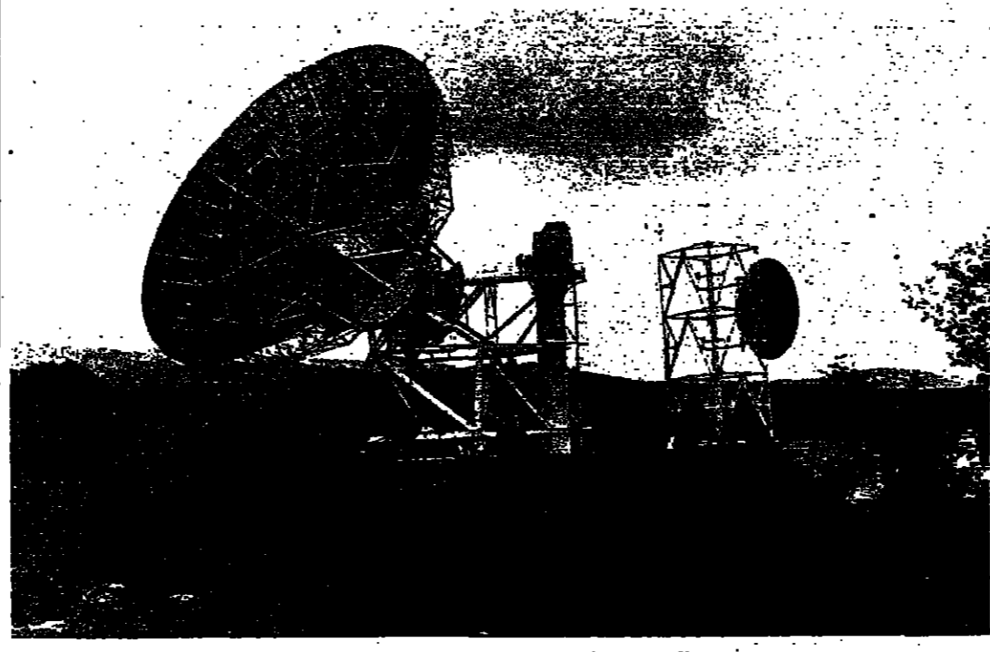
الوزير رونقيل ومراقبه لسدى نقده (هوائي) العربية